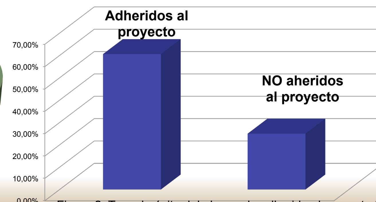
Figura 2. Tasa de éxito del alumnado adherido al proyecto frente al no adherido.